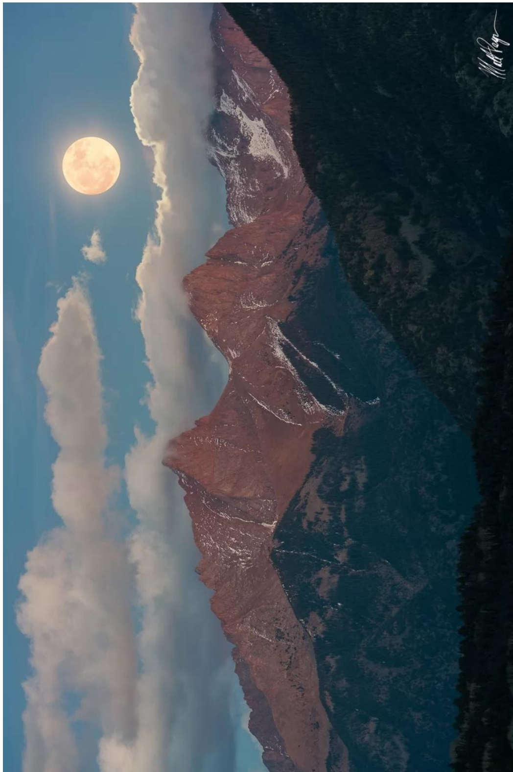
Пълнолуние в Колорадо – към Задача 3.